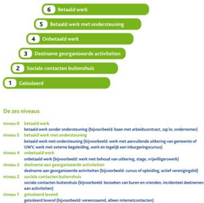
Figuur 1. Visualisering van de participatieladder met zes treden

“Al is het maar dat iemand 1 keer per week bij een wijkcentrum een kopje koffie gaat drinken, dat vinden wij al een hele vorm van participatie, want dat betekent dat je buiten komt, dat je een gesprek kunt voeren, dat je wat meer ziet wat er hier in de maatschappij gebeurt. Dat je misschien andere mensen ontmoet met wie je een gesprekje kunt hebben, en van lieverlee kun je misschien wel in een kookcursus, of een fietsles. Nou ja, zo kun je beter je kinderen ondersteunen op school, kan je de taal leren, dat soort dingen.”